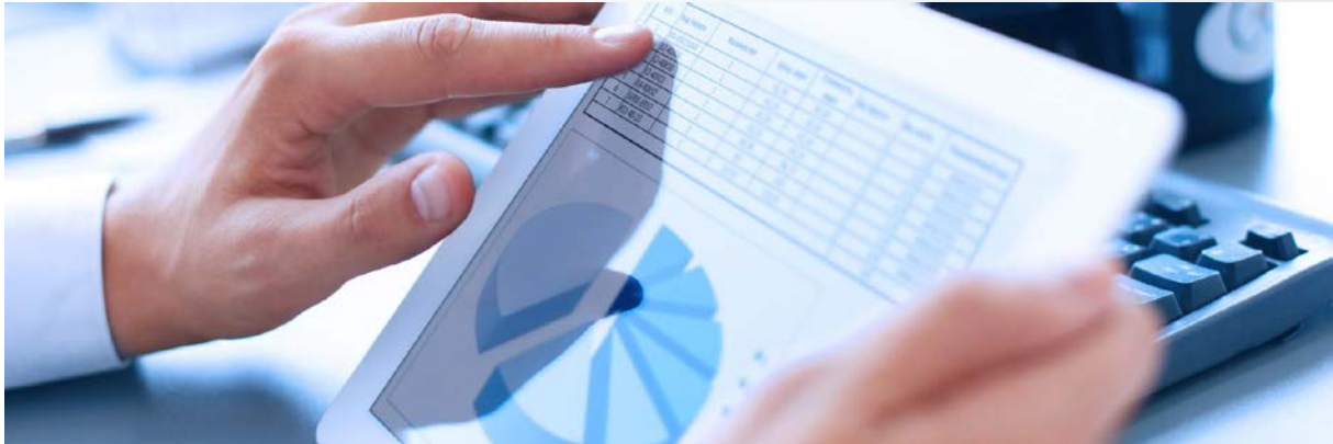
Industrie 4.0 / Smart Factory